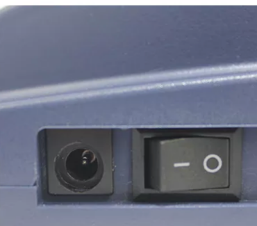
DC 6V/2.5AH AC power